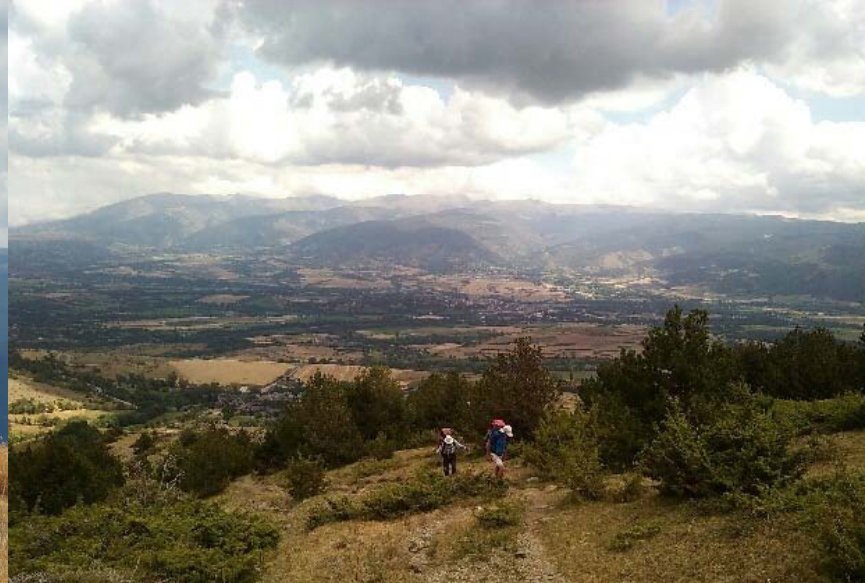
Jour 1 : Montée de 900 m vers le refuge de Malniu (2130m). Orage et grêle menaçants mais évités. Pour cette première soirée nous partageons le porto porté de Portet par JPC. (les douches dans un bunker extérieur feraient un parfait décor de film d'épouvante)