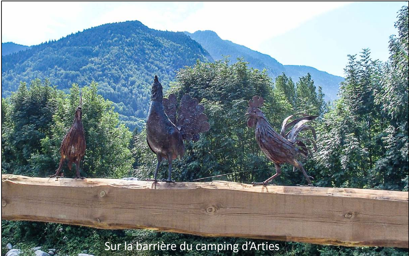
Sur la barrière du camping d'Arties

Jour 10 : Redescente tranquille sur Arties et installation au camping. A sept, à six puis à quatre, nous avons parcouru 170 km sans nous perdre. Les conditions ont été idéales. A Arties, certains s'arrêtent, d'autres continuent... Comme toujours, les étapes sont trop longues et les sacs trop lourds, mais peut-être aimons-nous ça !