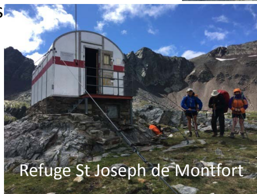
Refuge St Joseph de Montfort

Jour 5 : départ à regret de ce lieu superbe pour gravir les 500 m qui nous séparent du col de Baiau (2760 m) et revenir sur le versant espagnol. Nous aurons passé 3 nuits en Andorre. Temps menaçant froid avec beaucoup de vent mais paysage grandiose. Jolie descente le long du Rio Baiau en direction du refuge Val Ferrera puis grand morceau de piste jusqu'au village d'Areu (1230m) où nous attend notre appartement et le restaurant. Nous avons une pensée pour les musiciens chargés de leurs instruments qui passent le même col. Le temps passe au beau en fin de journée. Un peu de fatigue après cette longue étape ( 500m de montée 1400m de descente et autour de 17 km). Bel étendage de culottes sur la place de l'église.