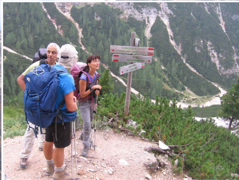
Paysage très sauvage, mais le balisage est toujours à la hauteur