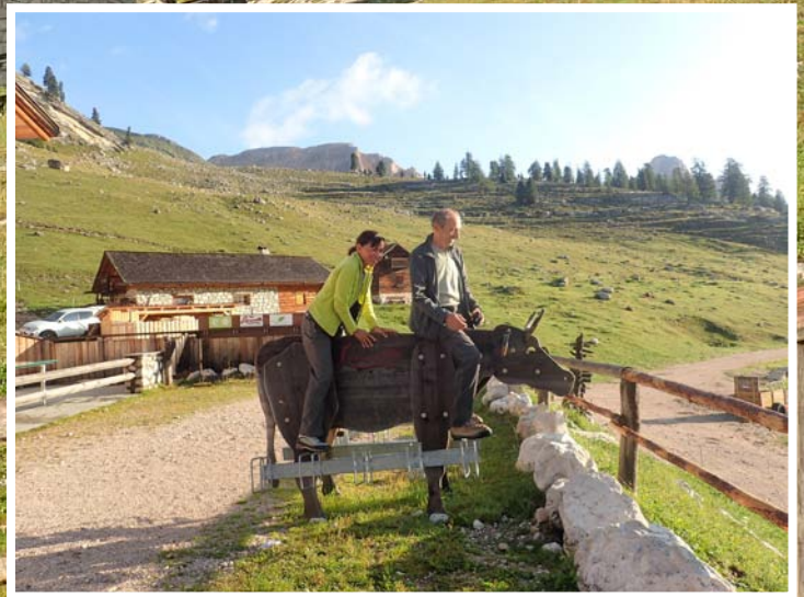
Très gros orage dans la nuit (heureusement, nous ne campons pas), qui nous offre un grand soleil au matin