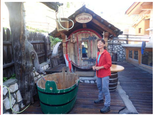
Véritable sauna finlandais chauffé au bois