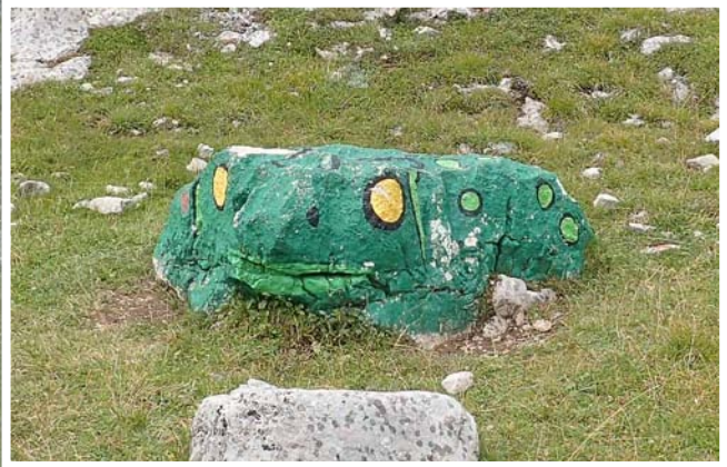
Drôle de rocher

Nous arrivons sur un petit plateau à l'extrémité duquel on aperçoit le vallon de Fanes et les refuges Lavarella. Nous y sommes presque mais la pluie nous rattrape à 200m du refuge