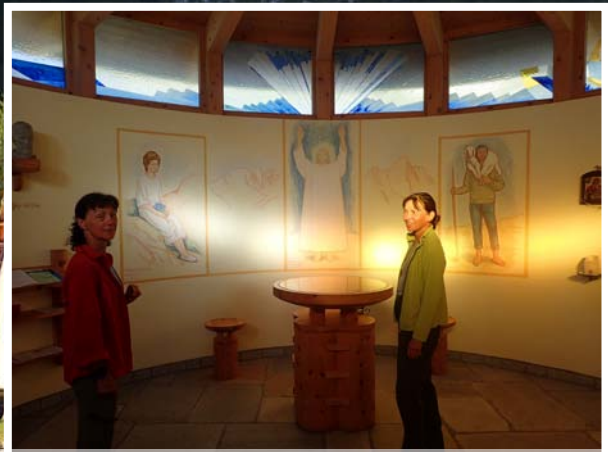
Il y a une chapelle à coté de chaque refuge