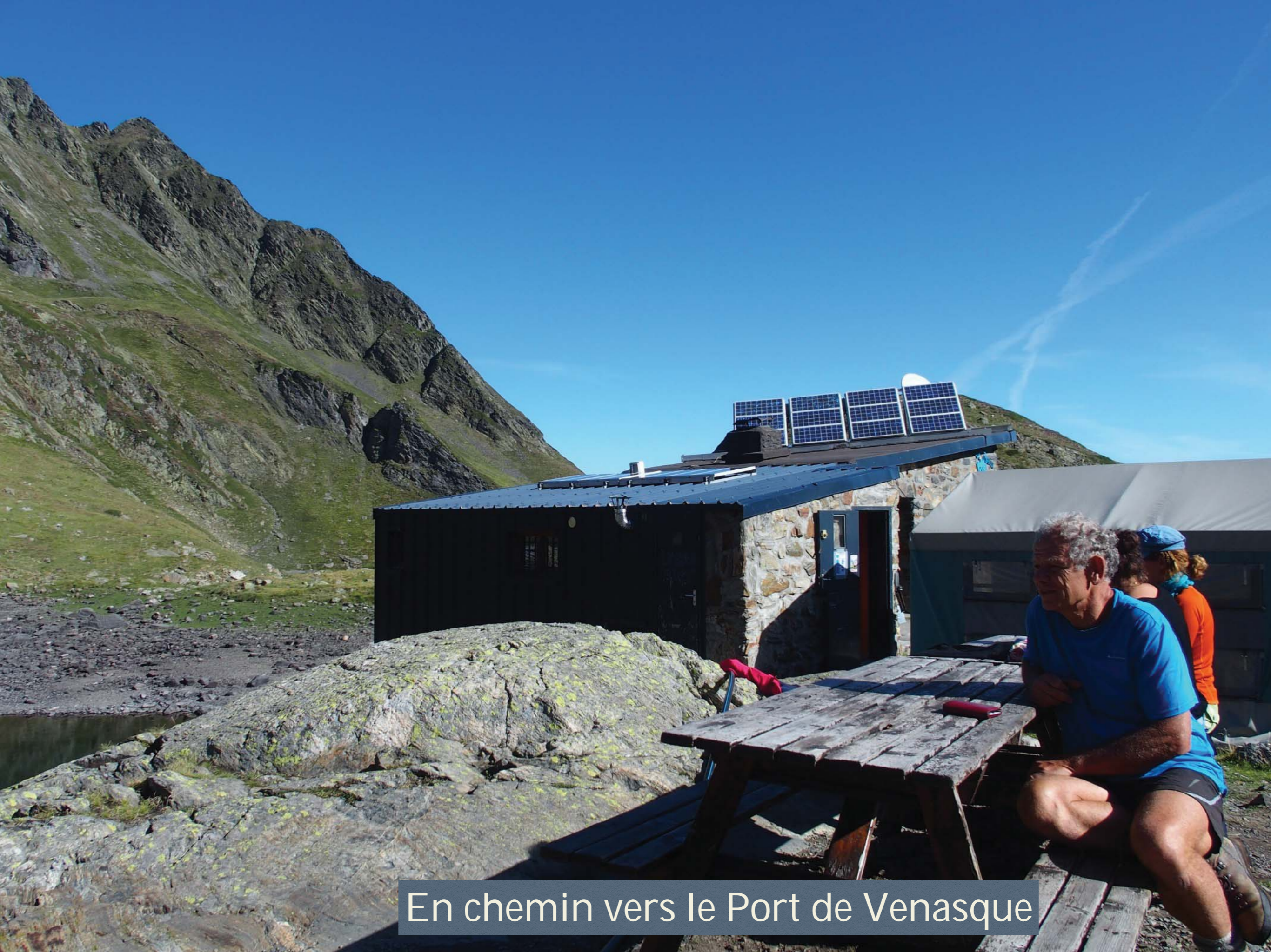
En chemin vers le Port de Venasque