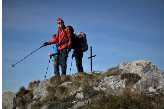
Pic du Midi de Bordes