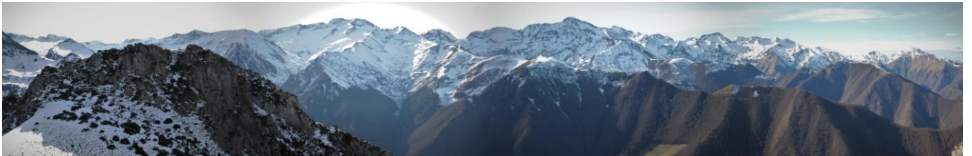
Depuis le sommet