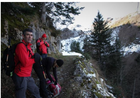
Vers la cabane de la Lee