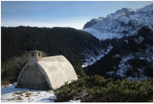
Refuge Salvador (fermé)