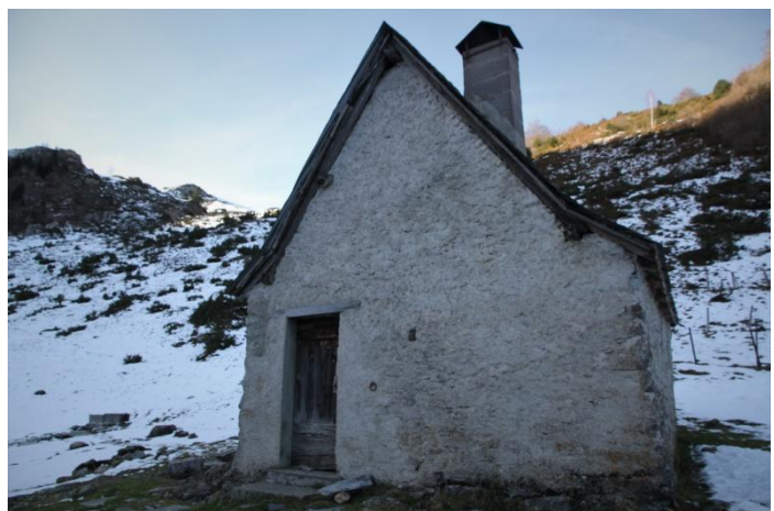
cabane de la Lee