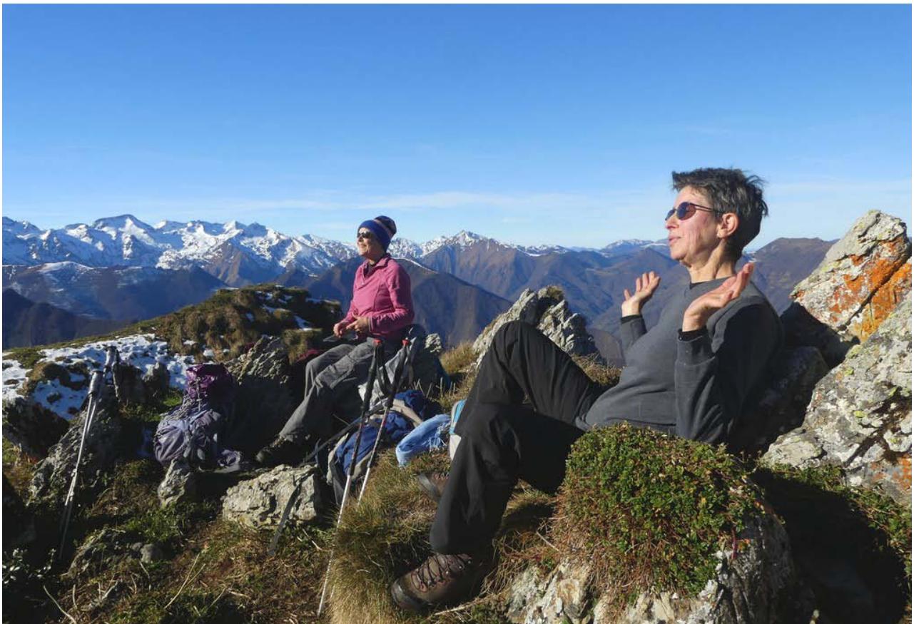
Extase aux Camaus