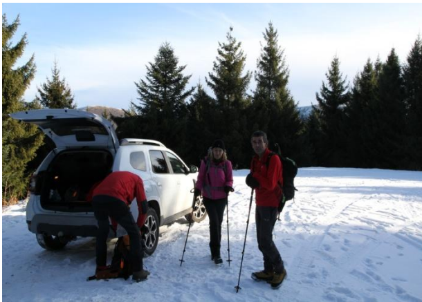
Parking de Mont Noir