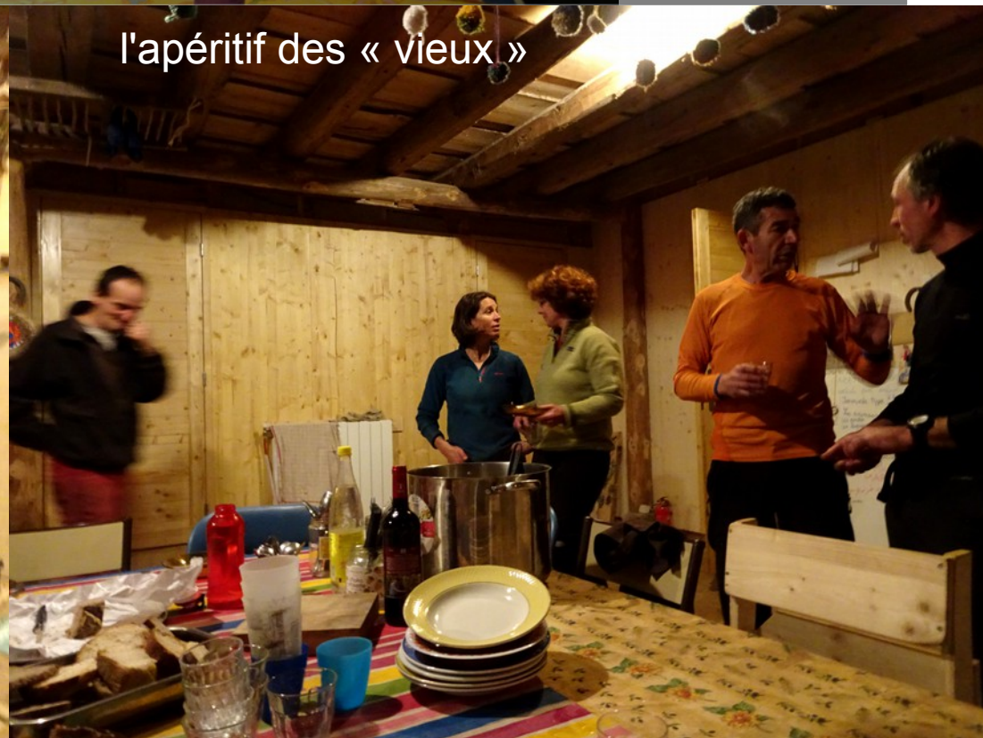
l'apéritif des « vieux »