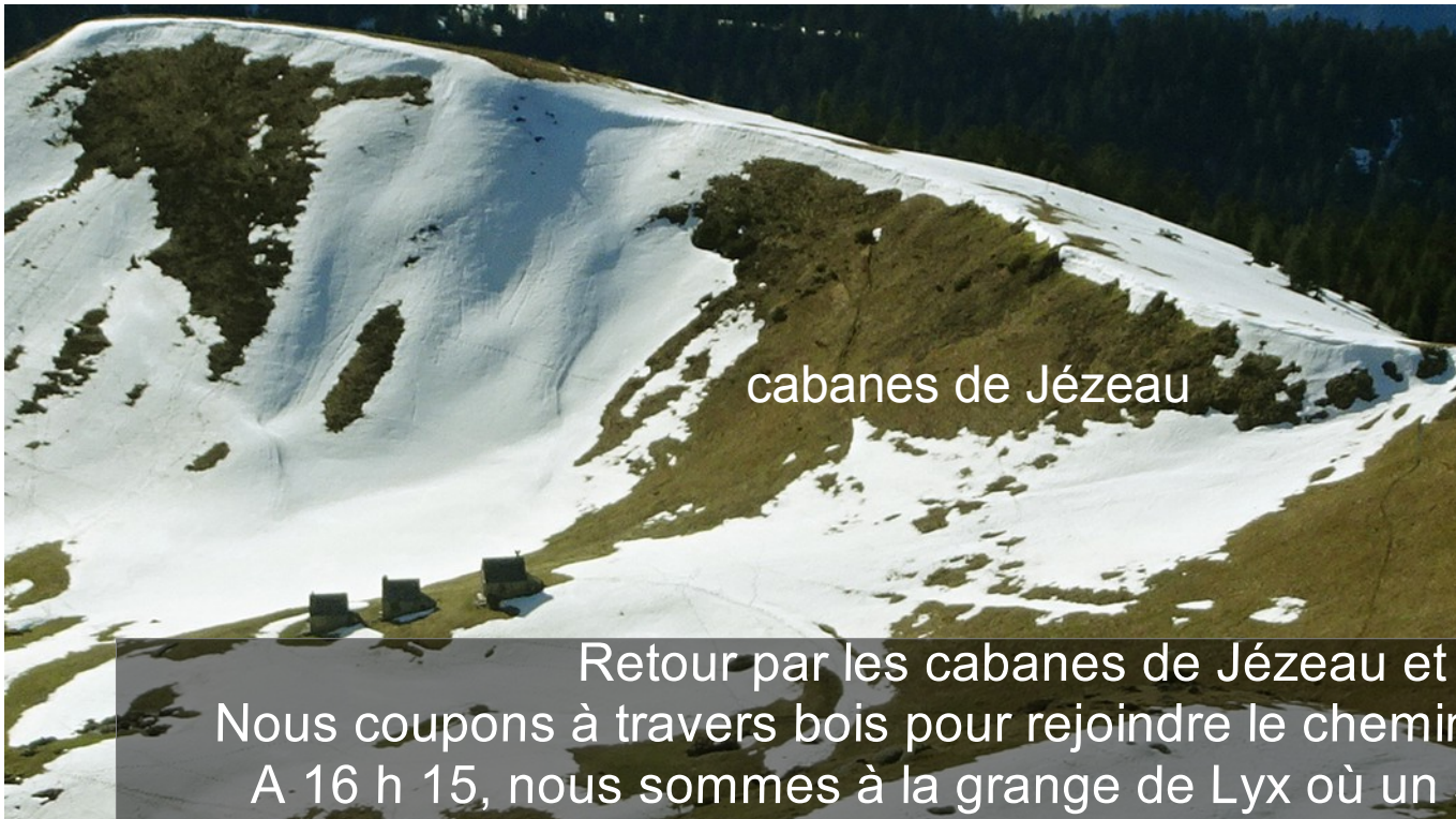
cabanes de Jézeau