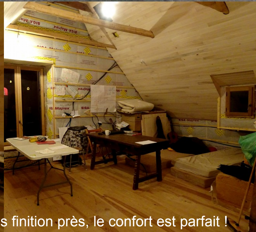
Depuis juin, les travaux ont bien avancés. A quelques finitions près, le confort est parfait !