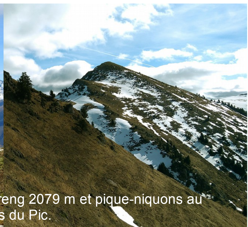
Par la crête de Montaut, nous arrivons à la Montagne d'Areng 2079 m et pique-niquons au soleil à l'abri du vent en contrebas du Pic.