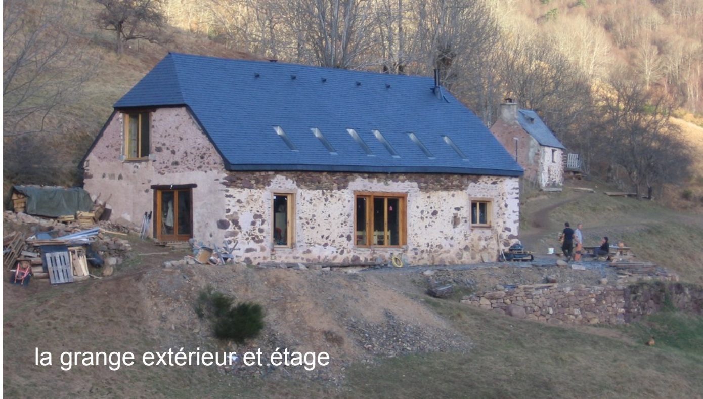
la grange extérieur et étage