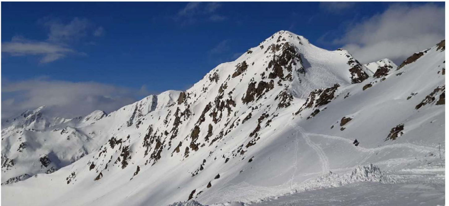
Retour par versant sud ouest