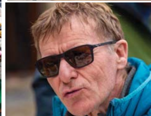
Cuisine, pauses, repas