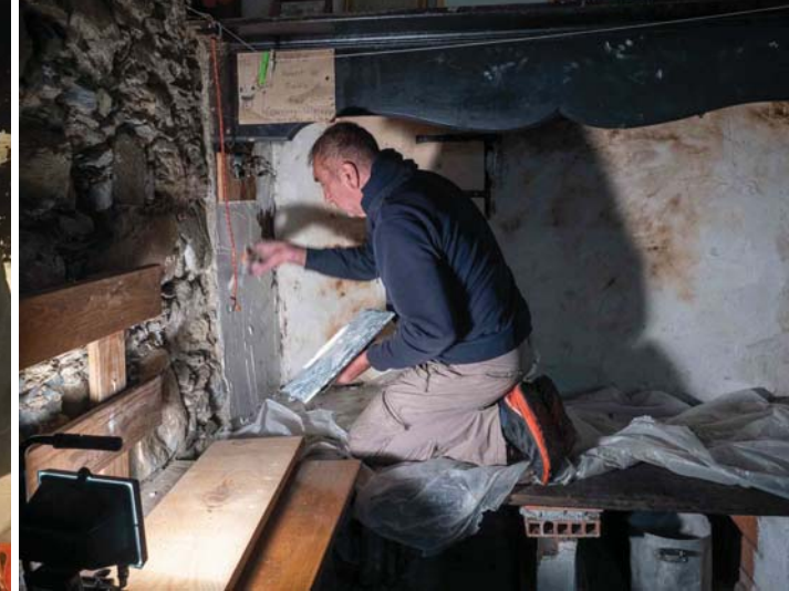
Cheminée nettoyée et blanchie au plâtre (sera peinte). Nouvelle porte pour le four à pain