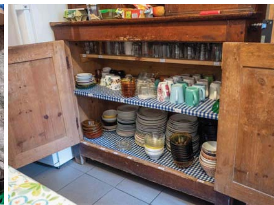
Ménage complet. Draps lavés et changés. Rangement et nettoyage de la cuisine et de l'arrière cuisine.