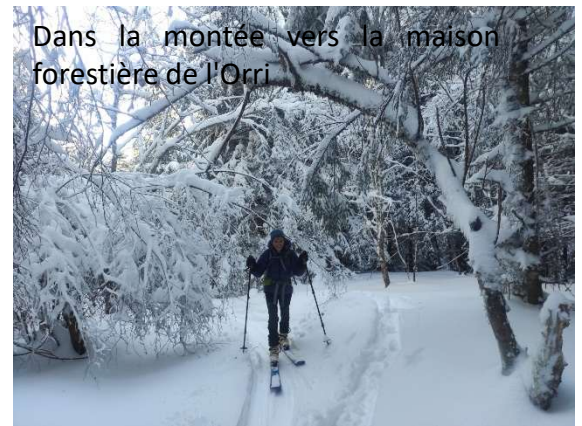
Dans la montée vers la maison forestière de l'Orri