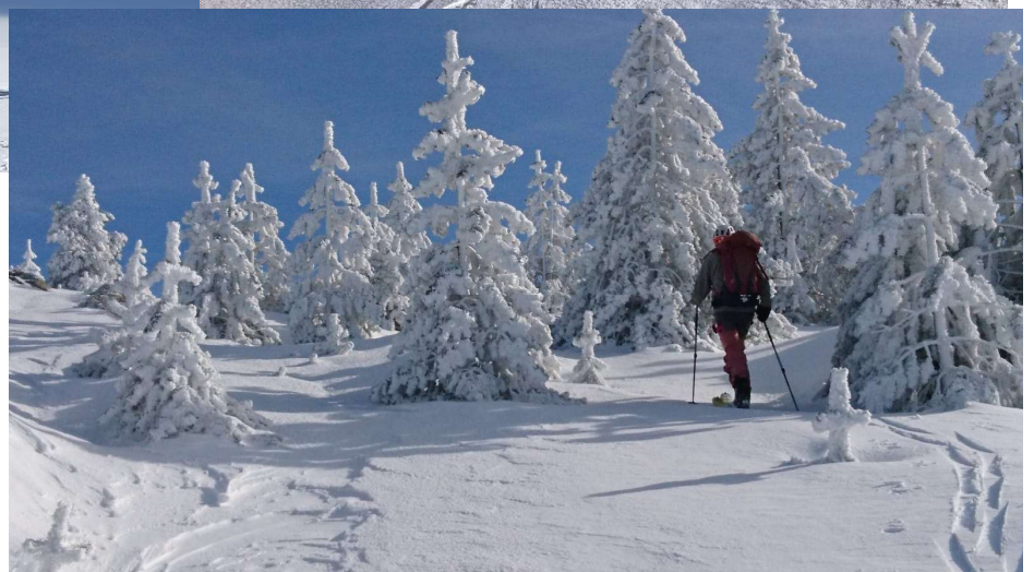
Presque au sommet, avec une ambiance hivernale rare