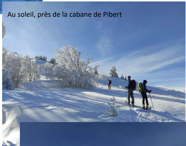
Au soleil, près de la cabane de Pibert